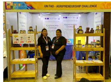
Зураг 7. Улаанбаатар түншлэл 2023 үзэсгэлэн

Бүтээгдэхүүний борлуулалтын орлогыг өсгөх, олон нийтэд танигдах байдлыг дэмжих зорилгоор нийт 7 компанийг Намрын Ногоон Өдрүүд 2023 болон Улаанбаатар түншлэл 2023 үзэсгэлэн худалдаанд оролцуулсан. Түүнчлэн, “Agripreneurship Challenge” тэмцээний шилдэг оролцогчдын үйл ажиллагааг төсөл хэрэгжүүлэгч ХХААБ, ОУХБ болон НҮБХХ-ын ажилтнуудад танилцуулах арга хэмжээг зохион байгууллаа.