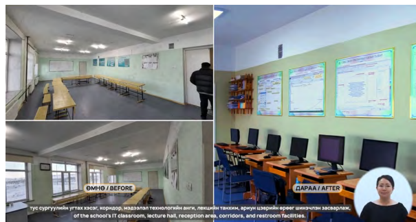
Зураг 4. Баянчандмань Политехник Коллежийн хүртээмжтэй сургалтын орчин

“Энтрепренершип ба бизнес эрхлэх үр чадвар” чадамжид суурилсан сургалтын 40 цагийн хөтөлбөрийг ХНХЯ болон ХНХСҮСИ-тэй хамтран боловсруулсан. Уг хөтөлбөрийг үр дүнтэй хэрэгжүүлэх, удирдлага, арга зүйгээр хангах зорилгоор “Хөтөлбөр хэрэгжүүлэх удирдамж”-ийг боловсруулж, сургалт зохион байгуулах нөхцлөөр хангаад байна.