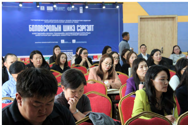
Зураг 3. “Боловсролын шинэ сэргэлт” семинар, 2023.09.24