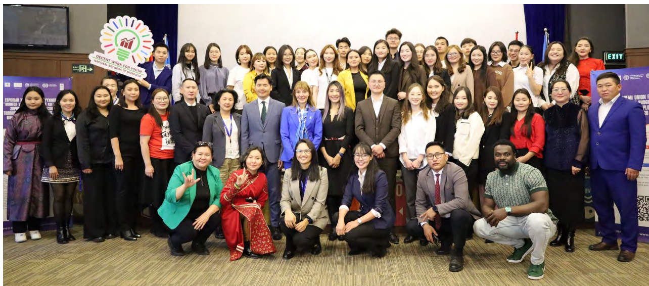
Зураг 9. Дижитал шийдлийн Хакатон арга хэмжээ 2023.09.29

Монгол Улсад залуучуудын хөдөлмөр эрхлэлтийн асуудлыг технологи ашиглан шийдвэрлэх, залуучуудад зориулсан зохистой хөдөлмөрийг дэмжих шинэлэг шийдлүүдийг боловсруулж турших, залуучуудын зохистой хөдөлмөр эрхлэх, хөдөлмөрлөх эрхийг хамгаалахад тулгамдаж буй асуудлыг шийдвэрлэхэд дэмжлэг үзүүлэх зорилготой Дижитал шийдлийн хакатон арга хэмжээг зохион байгууллаа.