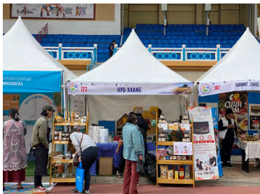
Зураг 6. Намрын ногоон өдрүүд 2023 үзэсгэлэн