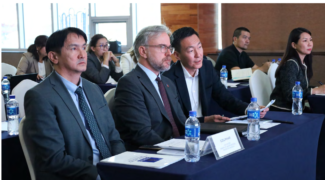
Зураг 2. “Хуримтлалын нэгдсэн сангийн хуулийн төслийн хэлэлцүүлэг, 2023.10.27

Дагалдан ажилтанг ажлын байранд дадлагажуулах замаар ажилтан, ажил олгогчийг дэмжих туршилтын төслийг ХНХЯ-тай хамтран боловсруулж, Хөдөлмөр эрхлэлтийн үндэсний зөвлөл (ХЭҮЗ)-өөр батлуулсан. Энэхүү туршилтын төсөл 2023-2024 онд 11,8 тэрбум төгрөгийн төсвөөр нийт 5,000 иргэнд ажил олгогчийн захиалгад үндэслэн санхүүгийн дэмжлэг үзүүлэх зорилготой бөгөөд нийслэл, орон нутгийн эдийн засгийн тэргүүлэх чиглэл болон “Шинэ сэргэлтийн бодлого”-той нягт уялдан хэрэгжих юм.