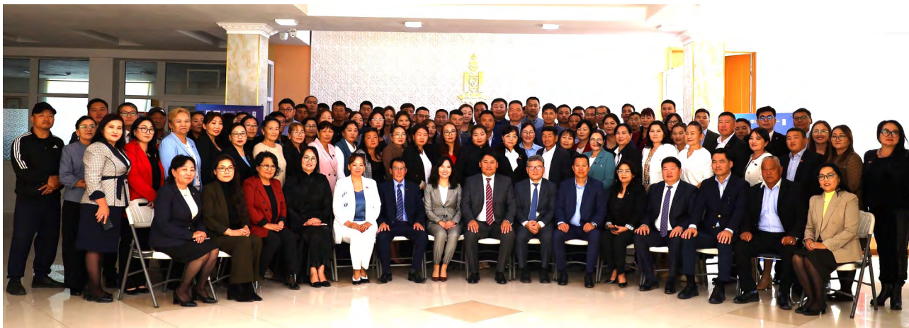
Зураг 1. “Үр дүнд суурилсан удирдлага” сургалт семинар, Дорноговь аймаг, 2023.09.21

Тогтвортой хөгжлийн зорилго (ТХЗ)-той уялдсан үр дүнд суурилсан удирдлагыг нэвтрүүлэх ажлын хүрээнд Дорноговь аймгийн, аймаг сумын Иргэдийн төлөөлөгчдийн хурал (ИТХ)-ын төлөөлөгч, ИТХ-ын ажлын албадын чадавхийг “Үр дүнд суурилсан төлөвлөлт, төсөвлөлт”-ийн чиглэлээр бэхжүүлэхэд дэмжлэг үзүүлсэн.