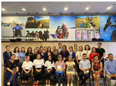
Зураг 5. “Agripreneurship Challenge” тэмцээний шилдэг оролцогчдыг ХХААБ, ОУХБ болон НҮБХХ-ын ажилтнуудад танилцуулах эвент