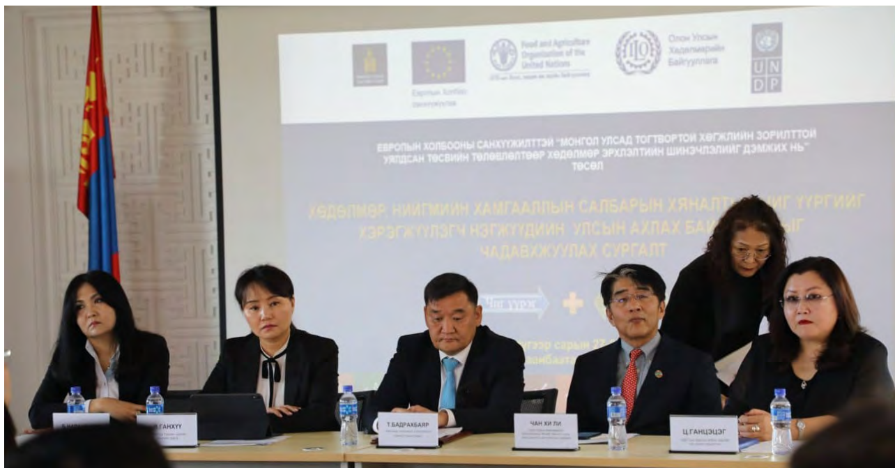
Зураг 8. Удирдах ажилтнуудын чадавх бэхжүүлэх сургалт семинар, 2023.09.27-28

2023 оны 9 дүгээр сарын 27, 28-ны өдөр зохион байгуулсан сургалтаар хөдөлмөр, нийгмийн хамгааллын салбарын хяналтын улсын ахлах байцаагч нарын чадавхыг дараах чиглэлээр бэхжүүллээ. Үүнд: