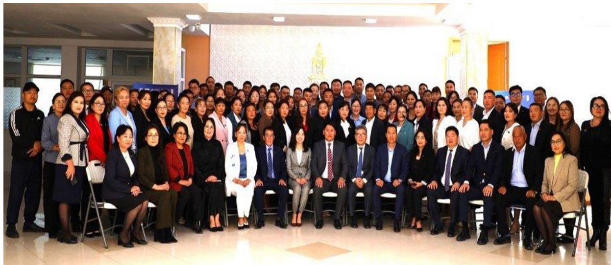
Зураг 1: ‘Үр дүнд суурилсан менежмент’ сургалт семинар, Дорноговь аймаг, 2023 оны 9-р сар

Мөн орон нутгаас сонгогдсон төлөөлөгчид болох Дорноговь аймгийн иргэдийн төлөөлөгчдийн хурлын гишүүдэд зориулсан үр дүнд суурилсан удирдлага, орон нутгийн төлөвлөлт, төсөвлөлт болон тайлагналын талаарх сургалтыг ‘Үр дүнд суурилсан удирдлага’ 2023 оны 9 дүгээр сард зохион байгуулсан. Ойролцоогоор 120 орон нутгийн гишүүн, төлөөлөгч сургалтад оролцсон.