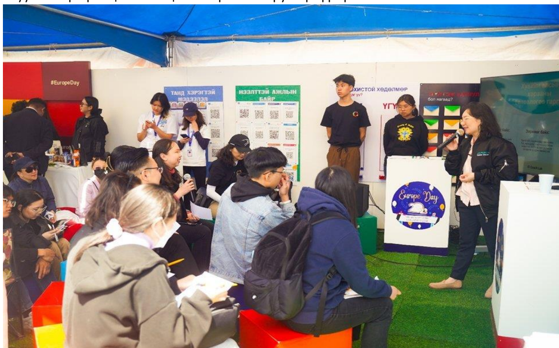
Зураг 8: Залуусын ирээдүйн карьерт дэмжлэг үзүүлэх богино сургалтууд, Европын өдөрлөг, 2023 оны 5-р сарын 14

Төслийн асарт нийт 2000 гаруй хүмүүс зочилсон ба ажил мэргэжлийн хөгжлийн сургалтад 85 орчим залуус биеэр оролцсон бол цахимаар 4600 гаруй хүмүүс үзсэн байна.