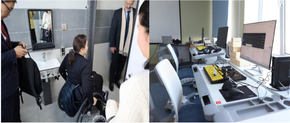
Зураг 3, 4: Хүртээмжтэй сургалтын орчин, Баянчандмань политехникийн коллеж 11-р сарын 10.

“Ухамсартай манлайлал” болон “Хүнс, хөдөө аж ахуйн салбарын манлайлалд зан үйлийн өөрчлөлт хийх нь” хэмээх 2 төсөл шалгарсан. Эдгээр хоёр дэд төслийн туршилтаар дараах үр дүнд хүрсэн.