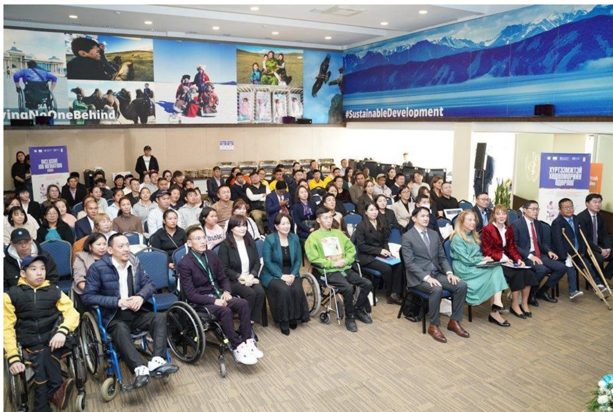
Зураг 7: "Хүртээмжтэй Хөдөлмөрийн Өдөрлөг", 2023 оны 10-р сарын 25

Тус өдөрлөгийн үр дүнд зорилтот нийт 50 ажил хайгч ХБИ-ээс 28 хувь нь хөдөлмөрийн гэрээгээ амжилттай байгуулсан бол үлдсэн иргэдийг цаашид ажлын байранд зуучлах, дэмжлэг туслалцааг үргэлжлүүлэн үзүүлж байна. Энэхүү арга хэмжээнд нийтдээ 120 гаруй хүн шууд оролцож, үр шимийг нь хүртсэн бол хамгийн багадаа 900 гаруй хүн шууд бусаар хамрагдсан юм.