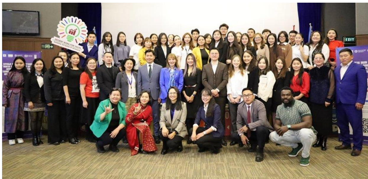
Зураг 5: Дижитал шийдлийн хакатон, 2023 оны 9-р сарын 29

Хөдөө аж ахуйн салбарын 150 орчим залуучуудад зориулсан хөдөлмөрийн хуулийн сургалт семинарыг 2023 онд Залуучуудын Зохистой Ажиллах Сүлжээ (DWYN)-ээс НҮБ-ын ХХААБ-аас хөдөө орон нутгийн хөрөнгө оруулалтын чиглэлээр зохион байгуулсан сургалттай хамтруулан зохион байгуулахад дэмжиж ажилласан.