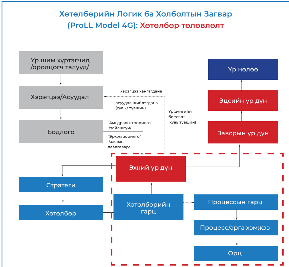
Зураг 1. Төсөвлөлтийн үе шат.

ҮДСНУ-ын загвар нь оролцогч талууд болон нийгмийн зорилтот бүлгүүдийн асуудал, хэрэгцээг нарийвчлан шинжилсэн эрэлтийн шинжилгээнд үндэслэн асуудал, хэрэгцээг шийдвэрлэхэд шаардлагатай өөрчлөлтийг (эхний үр дүн) тодорхойлдог. Эхний үр дүн нь тухайн түвшний бодлогын тэргүүлэх чиглэлийг илэрхийлдэг. Эхний үр дүнд хүрэх арга зам буюу стратегийг тодорхойлж хөтөлбөрөөр хэрэгжүүлнэ. Хөтөлбөр нь зорилтот үр дүнг бий болгох гарц, гарцыг бий болгох багц “арга хэмжээ” эсвэл “үйл явц” буюу “процесс”-оос бүрдэнэ.